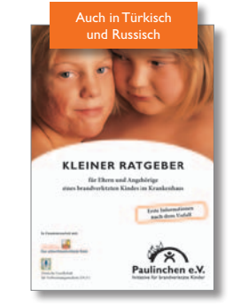
20. Kleiner Ratgeber für Eltern und Angehörige eines brandverletzten Kindes im Krankenhaus