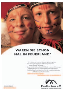
11. Plakat „Feuerland“