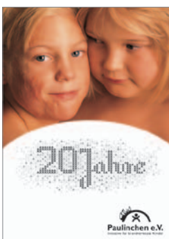
16. „20 Jahre Paulinchen“