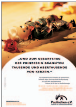
14. Plakat „Puppe“