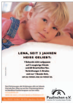
9. Plakat „Lena“