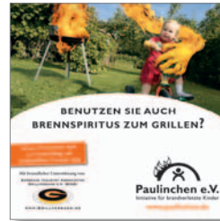
4. CD Präventions-Spot „Grillen ohne Spiritus“ Länge: 60 sec.. Format: mpg