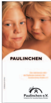
2. Info-Flyer Paulinchen e.V.