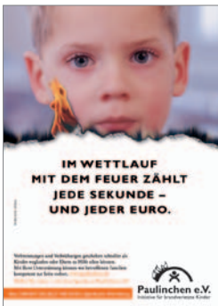
8. Plakat „Junge“