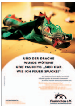
12. Plakat „Drache“