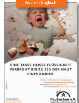
10. Plakat „Verbrühung“ Deutsch auch in DIN A3 und DIN A4