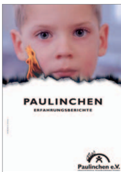
17. Paulinchen – Erfahrungsberichte