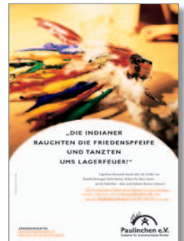
15. Plakat „Indianer“