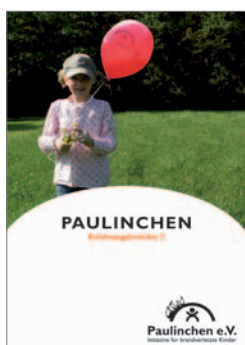
18. Paulinchen – Erfahrungsberichte 2