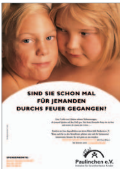
6. Plakat „Mädchen“ auch in DIN A3