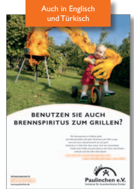
5. Plakat „Grillen“ Deutsch auch in DIN A3 und DIN A4