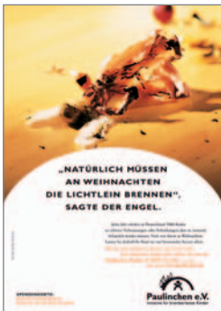
13. Plakat „Engel“