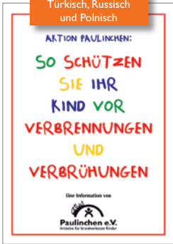
1. Aktion Paulinchen „So schützen Sie Ihr Kind vor Verbrennungen und Verbrühungen“

Auch in Englisch, Türkisch, Russisch und Polnisch