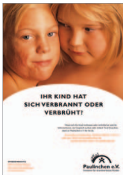
7. Plakat „Mädchen 2“ auch in DIN A3